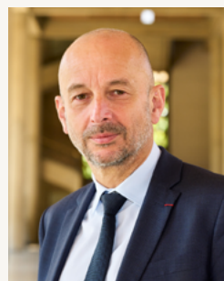
Thierry Beaudet Président du Conseil économique, social et environnemental

mais par des pratiques. À l'heure où les fractures sociales s'accroissent, où la parole politique peine à convaincre, il est urgent de réinventer des formes d'engagement plus ouvertes, plus inclusives, conçues et animées par la société civile elle-même. Ce prix, qui récompense les initiatives les plus marquantes, en est une magnifique illustration. »