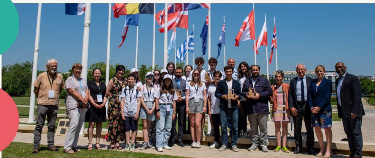
Mathis Harpham / Ouest-France