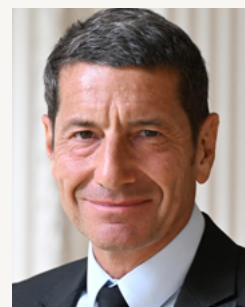
Stéphane Geuroi / Ouest-France

En valorisant l'engagement civique, le Prix de la démocratie incarne aussi cette ambition de démontrer la puissance de la démocratie par ce qu'elle a de concret. Notre démocratie est un trésor : n'attendons pas de la perdre pour en apprécier la valeur. »